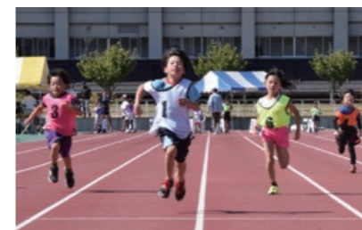
全国順位の上位を目指して、全力で駆け抜けませんか

50m走と100m走の大会です。自分の全国順位を公式サイト( http://www.kakekko-japan.com/ )で確認できます。 ▶とき…10月14日(月・祝) ▶ところ…あいづ陸上競技場 ▶対象…5歳以上の人 ▶費用…◎大人=1,100円◎高校生以下=600円 ▶申し込み方法…公式サイトから申し込むか、あいづ陸上競技場や各体育館にある申込書に記入し、参加費を添えて、あいづ陸上競技場や各体育館へ申し込み ▶締め切り…9月29日(日) ◎問い合わせ…あいづ総合体育館(☎28-4440)