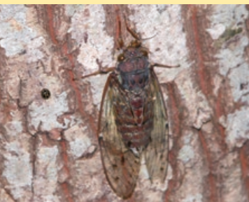
ヒグラシは、漢字で「秋蝸」などと表記され、秋の季語になっています

ヒグラシは、カメムシ目セミ科に属するセミで、体長はオスが3から4cm程度、メスが2cm程度です。オスの腹部は音を共鳴させるために空洞で、メスに比べて腹部が大きく長いので、オスとメスを容易に見分けることができます。体色はおおむね赤褐色ですが、山地では黒色になる傾向があるなど、生息地域により異なります。7月から9月ごろによく見られ、日の出前または日の入り後の薄明かり時などに「カナカナカナ」と美しい音色を奏でます。生息範囲が広く身近な生き物として市内全域で見ることが出来ます。